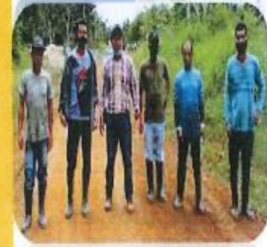
Comisión de Desarrollo Social, Cultura, Deportes y Nacionalidades

Periodo de gestión: Enero-Diciembre 2020