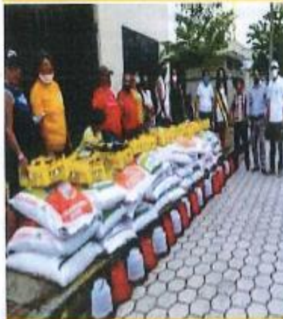
Participación en la entrega de kits de los proyectos productivos entregados a diferentes organizaciones de la parroquia Jambelí.