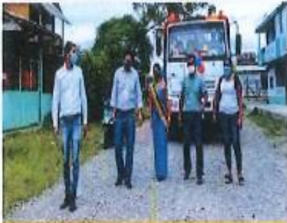
Participación en el aniversario 16 de parroquialización