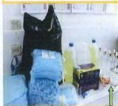
Entrega de kits de alimentos y bioseguridad por la emergencia sanitaria del COVID-19, a diferentes comunidades de la parroquia.