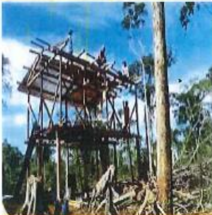
Apoyo en mingas solidarias para personas de escasos recursos.