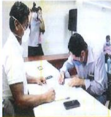
Firma de convenio bilateral con el municipio de Lago Agrio para la entrega de kits de alimentos y bioseguridad por la emergencia sanitaria del COVID-19